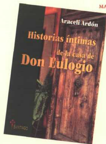
▲ Ardón, Araceli. (1998). “Historias íntimas de la casa de Don Eulogio”. México. Vieira.

Muchos han sido los que han tenido en su poder la pluma inteligente para cambiar el presente, la pluma visionaria para descubrir el futuro, pero en esta obra tenemos contacto con la pluma sensible que nos despierta una enorme capacidad para adentrarnos en las emociones del pasado, nues-